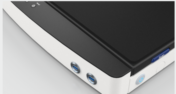
Almacene imágenes directamente en dispositivos USB 3.0